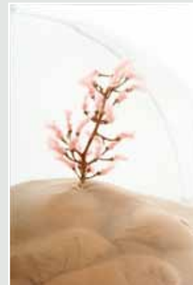
Pauline Stopp Detail aus dem Mobile: „Den Nackten kann man nicht ausziehen“, 2016 Rauminstallation mit Musik und verschiedenen Materialien in Kunststoffkugeln Gesamtgröße: 150 x 80 x 80 cm

*1937 in Wachstedt 1956–1959 Studium an der Arbeiter- und Bauernfakultät (ABF) für Bildende Künste in Dresden 1960–1965 Studium an der Hochschule für Bildende Künste in Dresden bei Hans Theo Richter 1962–1969 in Herrnhut ansässig seit 1969 freischaffender Künstler 1969–1972 in Dresden 1972–1998 in Drispeth 1998–2013 in Freiberg seit 2013 in Dambeck, Landkreis Ludwigslust-Parchim · Lebt und arbeitet in Dambeck