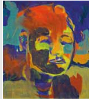
Willy Günther Schwester , 2010 Gouache auf Papier, 60,5 x 54 cm

*1988 in Bad Dürkheim 2008–2013 Studium der Bildenden Kunst (B.A.) und der Skandinavistik an der Ernst-Moritz-Arndt-Universität Greifswald, Auslandsjahr 2010–2011 an der Umeå universitet (Schweden) 2013–2018 Studium der Bildenden Kunst (M.A.) an der Ernst-Moritz-Arndt-Universität Greifswald seit 2017 Projektkoordinatorin der Offenen Nähwerkstatt Kabutze in Greifswald sowie Illustratorin und freie Künstlerin · Lebt und arbeitet in Greifswald